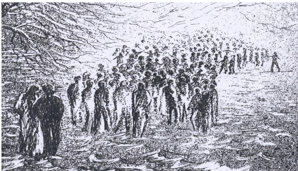
Dessin de Françoise Lempereur