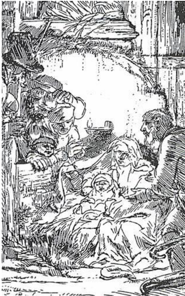
Rembrandt — Adoration des Bergers.

Chez Luc, les bergers viennent adorer le bébé qui vient de naître, avant qu'il ne soit "officiellement" présenté au temple.