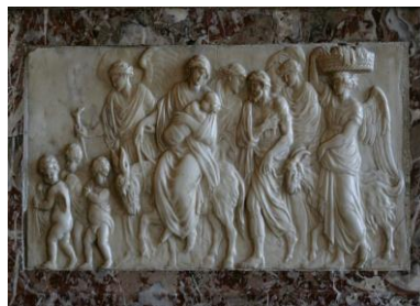
La fuite de l'Egypte Château de Versailles

La parole de Dieu capable de nous mettre en mouvement, capable de nous donner la force d'entreprendre et d'agir n'est pas n'importe quelle parole. C'est une parole libératrice, celle qui a donné aux hébreux la capacité de s'opposer au pharaon d'Egypte et de braver ses armées en s'enfuyant dans les déserts, échappant ainsi à la servitude. Le parallèle avec la situation que vit les exilés de Babylone est évident.