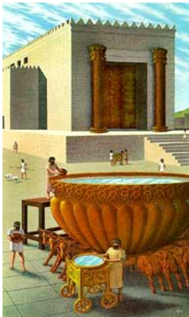
Temple de Salomon

Un seul homme, sûr de son fait, peut susciter un mouvement qui le dépasse infiniment. Son analyse était sage, toute société qui se développe sur des principes égoïstes est menacée d'extinction, parce qu'elle n'engendrera que replis sur soi, rapports de force et sentiments de jalousie. Seuls des projets communs, une éthique de vie, un sens des priorités peut donner à une société donnée une qualité de vie qui conduit au bonheur.