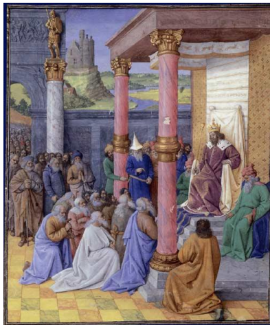
Cyrus et les Hébreux

magnanime et fin politique, le roi des Mèdes et des Perses, Cyrus, publie un édit autorisant les populations exilées à rentrer dans leur pays d'origine. Les juifs, bénéficiaires de cette promulgation, vont être encouragés à quitter les bords du Tigre et de l'Euphrate pour regagner les terres de leurs ancêtres et y reconstruire non seulement leurs demeures, mais également leur culture, culture dont le Temple de YHWH était la pierre angulaire.